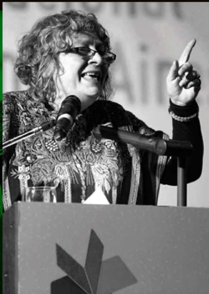
RITA LAURA SEGATO